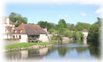
La Trimouille du XIème.

Au départ de l'office de tourisme de la Trimouille, traverser le pont sur la Benaïze puis prendre à droite direction St Pierre. Premier arrêt à St Pierre sur la petite place pour y découvrir près du château l'ancienne église de